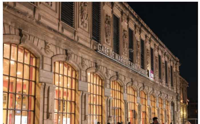
Bahnhof Marseille St. Charles SNCF